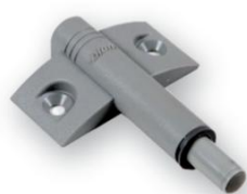
Cichy domykacz drzwi