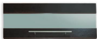
Drzwi płytowo-szklane 60,80,90