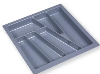
Wkład na szuflady 40, 50, 60, 80, 90