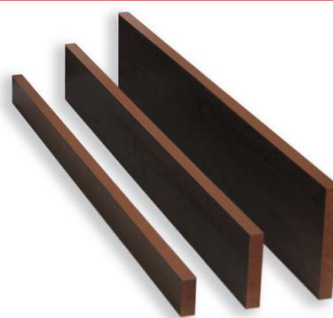
Maskowanie szafek pionowe