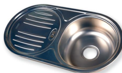
Zlew 1 komorowy