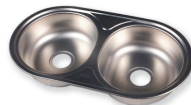
Zlew 2 komorowy