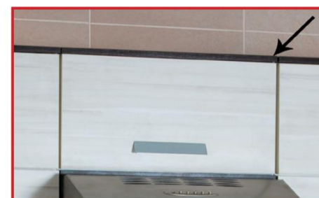
Pogrubiony wieniec szafek wiszących